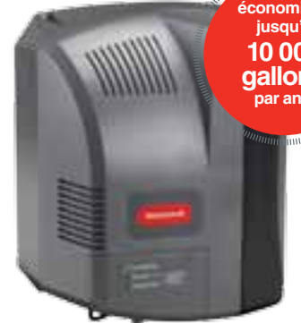
Modèle alimenté par le ventilateur

économisez jusqu'à 5 500 gallons par an**