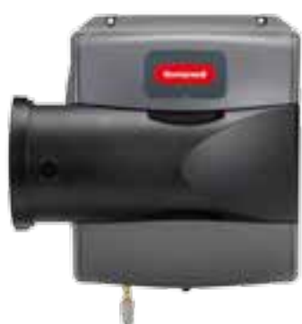
Modèle de base à dérivation

La gamme complète d'humidificateurs TrueEASE vous aide à distinguer votre entreprise des autres en offrant des options de mise à niveau auxquelles les propriétaires attachent de l'importance et, surtout, pour lesquelles ils sont prêts à investir.