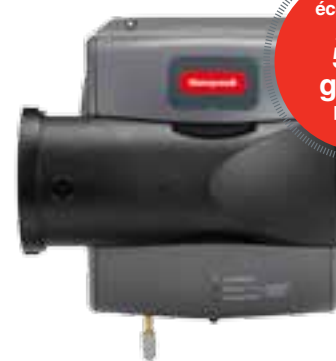
Modèle avancé à dérivation